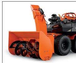
Mammoth Schneefräse: 122/91 cm