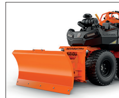
Mammoth Schneeschild: 122 cm