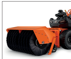
Mammoth Kehrbürste: 112 cm