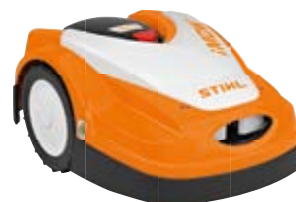
iMOW® MÄHROBOTER RMI 422 P

Vollautomatischer Mähroboter für Rasenflächen bis 1.500 m 2 . Schneidet, zerkleinert und düngt als Mulchmäher in einem Arbeitsgang. Schnittbreite: 20 cm, max. Steigung: 40 %.