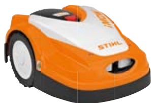
iMOW® MÄHROBOTER RMI 422

Vollautomatischer Mähroboter für Rasenflächen bis 800 m 2 . Schneidet, zerkleinert und düngt als Mulchmäher in einem Arbeitsgang. Schnittbreite: 20 cm, max. Steigung: 35 %.